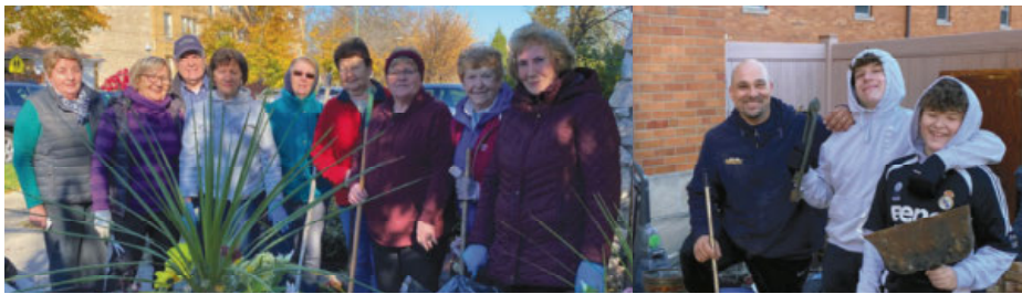
Serdeczne Bóg zapłać naszym wolontariuszom za hojność serca w porządkowaniu terenu wokół kościoła w sobotę, 11 listopada. Niech Bóg wynagrodzi Wasz trud!

We invite everyone to the adoration of the Blessed Sacrament in our church every Tuesday beginning after the 8:15am Mass. Benediction is at 6:45pm followed by a 7:00pm Mass in Polish. Please come and adore the Real Presence of Jesus. He waits for you.