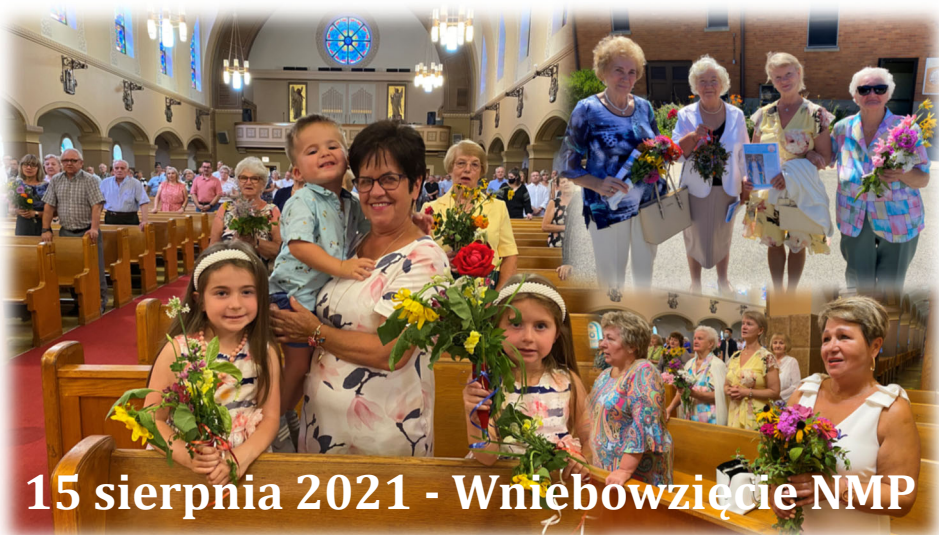
15 sierpnia 2021 - Wniebowzięcie NMP