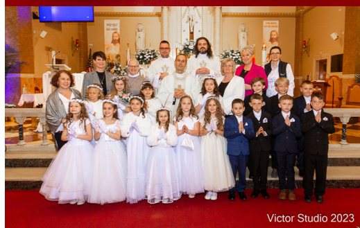
Victor Studio 2023