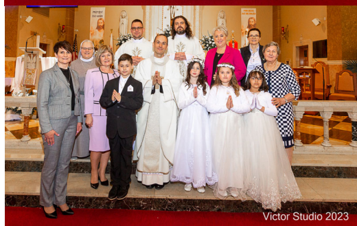
Victor Studio 2023