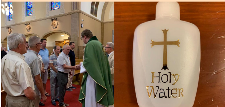
On Father's Day, all gentlemen received prayers and occasional gifts.

WELCOME NEW PARISHIONERS! WITAMY NOWYCH PARAFIAN!