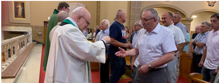
Z okazji Dnia Ojca panowie zostali obdarowani modlitwą oraz okolicznościowymi podarunkami.